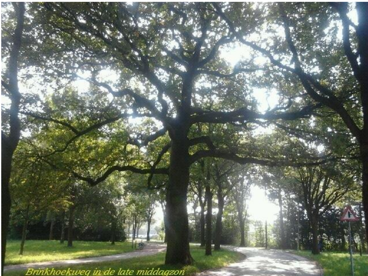
Brinkhoekweg in de late middagzon